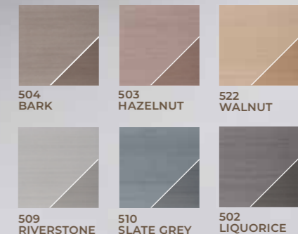
Natuurlijke verkleuring van de Twinson CHARACTER MASSIVE plank

De kleurstalen in deze brochure kunnen afwijken van de daadwerkelijke kleur van de terrasplanken.