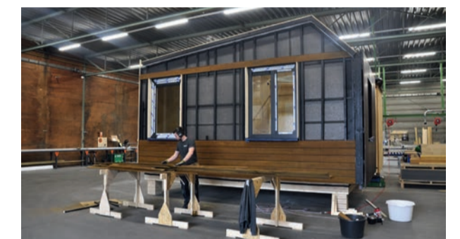
En tant que constructeur d'éléments préfabriqués, Tala peut concevoir, développer et produire les modules d'habitation dans son usine et y réaliser le placement des portes et fenêtres.

Outre l'excellent rapport qualité/prix des châssis installés, l'équipe de projet de Tala est très satisfaite de l'approche