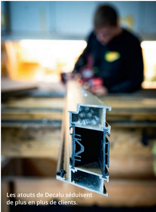
Les atouts de Decalu séduisent de plus en plus de clients.