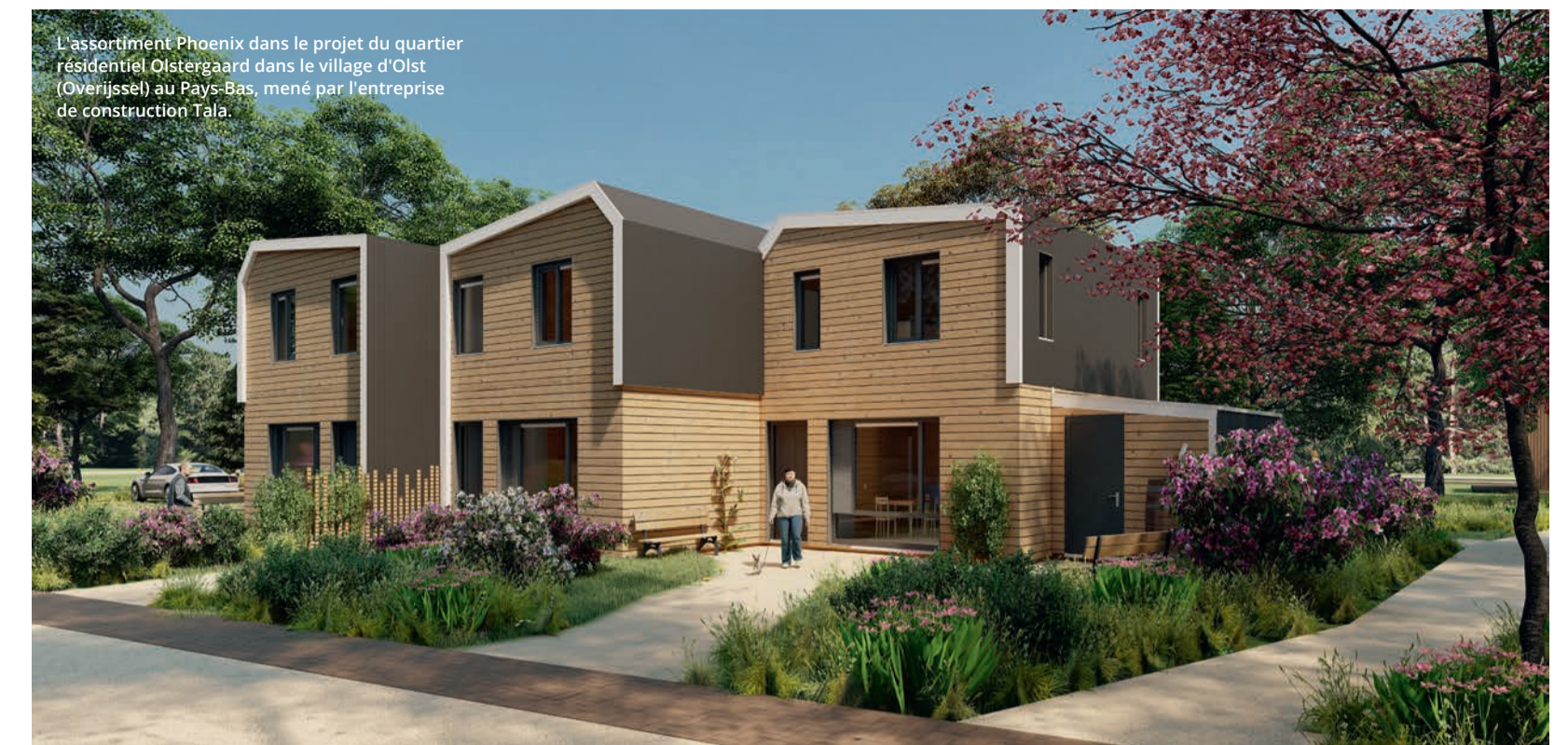
L'assortiment Phoenix dans le projet du quartier résidentiel Olstergaard dans le village d'Olst (Overijssel) au Pays-Bas, mené par l'entreprise de construction Tala.