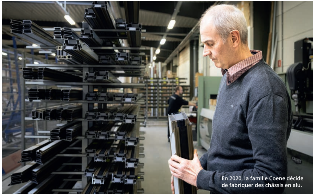
En 2020, la famille Coene décide de fabriquer des châssis en alu.