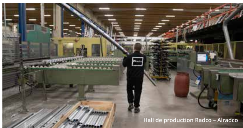
Hall de production Radco – Alradco