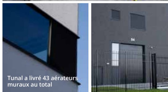
Tunal a livré 43 aérateurs muraux au total