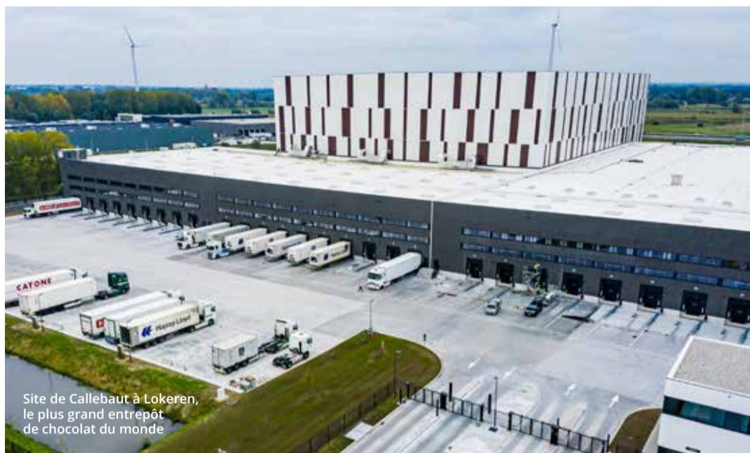
Site de Callebaut à Lokeren, le plus grand entrepôt de chocolat du monde